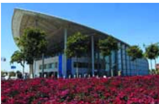
Palacio de Congresos de Valencia (imagen cedida por Turismo Valencia Convention Bureau).

Palacio de Congresos de Valencia Avenida Cortes Valencianas, 60 46015 Valencia