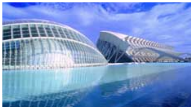
Ciudad de las Artes y las Ciencias

Regreso: 18:30 h, en los hoteles del Congreso