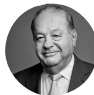
Carlos Slim PRESIDENTE DE LA FUNDACIÓN CARLOS SLIM

Es profesor Investigador ICREA en el Instituto de Bioingeniería de Cataluña. Obtuvo el Récord Guinness al "jet más pequeño creado por el hombre". En 2015 obtuvo el Premio Princesa de Girona a la Investigación Científica.