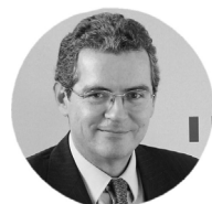
Pablo Isla PRESIDENTE DE INDITEX

También es el presidente y principal impulsor de la mayor iniciativa de la firma dedicada al talento en España: Human Age Institute.