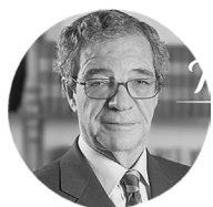
César Alierta PRESIDENTE DE TELEFÓNICA

Trabaja en Deportes Cuatro. En MediasetSport ha cubierto una Eurocopa sub21 de fútbol, los Eurobaskets de 2013, 2015 y 2017 y el Mundobasket de 2014.