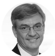
Fernando Ruiz PRESIDENTE DE DELOITTE ESPAÑA

Es director general de Google para España y Portugal y cofundador del Instituto Superior para el Desarrollo de Internet (ISDI).